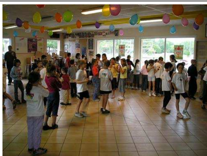
C'est vraiment chouette les boums ...