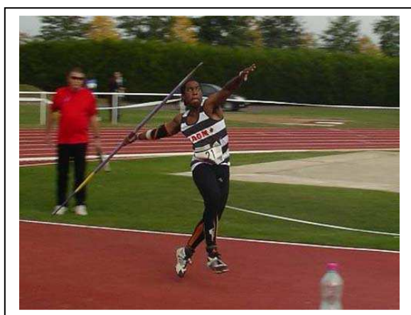
Bip - Bip